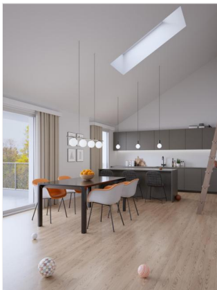
Küche und Essbereich